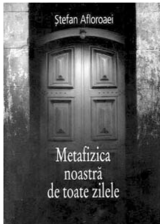
Jocul elementelor, colografie

dat” 3 . În acest fel vom înțelege că întreaga metafizică occidentală va funcționa, în cazul cărții de față, exclusiv ca subsol (sau, dacă preferăm, etaj) al unei argumentări terestre care își propune să întemeieze fenomenul speculativ. O formă de sensibilitate, o dispoziție, imagini, credințe, idei, limba vorbită, voința noastră, toate date ca forme ale vieții de zi cu zi, iată receptacolele în care (re)găsim, fenomenul speculativ. Să încercăm să le găsim, parcurgând invers drumul propus de Ștefan Afloroaei de la ultima secțiune înspre prima.